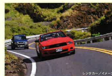
レンタカー/イメージ