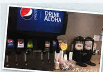
サービスドリンクの種類も豊富です。