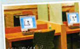
ご用意しているPCでハワイ情報の検索などにご利用ください。

新聞など各種閲覧可能です。インターネットやハワイのガイドブックもあるので、現地の情報収集に便利! ラウンジ内ならWi-Fiも無料で使えます。日本からお持ちの携帯電話の充電器もご用意しております!