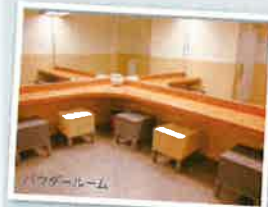
大きな鏡のあるパウダールームは女性にとって嬉しいサービスです。

ホテルにチェックインするまで時間がある方は、パウダールームでお化粧や着替えもできて便利。ロッカーに荷物を預けてショッピングへ出かけてみては?